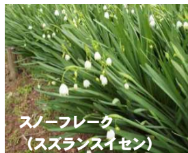
スノーフレーク (スズランスイセン)