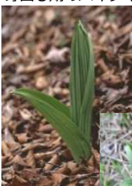
芽出し期のバイケイソウ