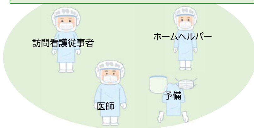
在宅ケアチームに送付する物資のイメージ(1週間分セット)